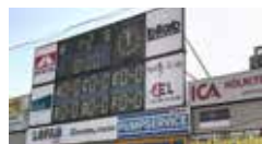
2 Modul 3x1 m vid resultatavla 10 000 kr