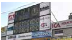
1 Ljusskylt vid resultatavla 15 000 kr