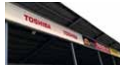
7 Modul 4x0,7 m front tak, huvudläktare 10 000 kr