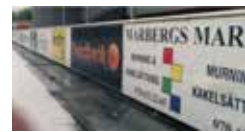
4 Modul 3x1 m längs isen vid huvudläktaren 8 000 kr