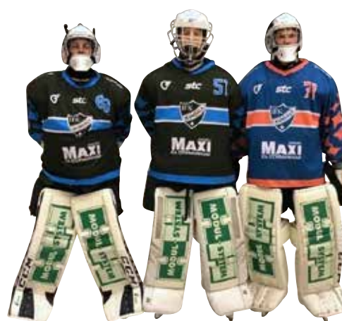
Målvaktsbenskydd offereras separat

(Exkl reklamskatt samt tryck-/och tillverkningskostnad)