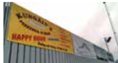
6 Modul 4x1 m ovan entréläktaren, broside 7 000 kr