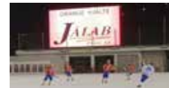
8 Storbildsskärm vid större matcher. Rörlig reklam 15-20 sek vid minst två tillfällen. 15 000 kr