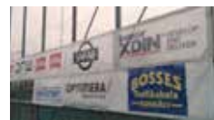
3 Modul 5x1 m kort-sida 10 000 kr